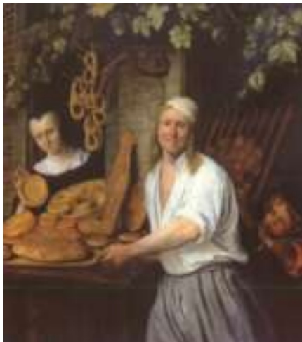
Personne qui fait et vend le pain.